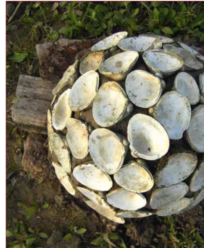
Auart, eine Kooperation des Leistungskurses 13 Bildende Kunst des Hans-Purmann Gymnasiums Speyer und der Rucksack schule des Forstamtes Pfälzer Rheinauen.

BNE Gelungene Aktionen machen Spaß, ermuntern zur Wiederholung mit Freunden und Spielkameraden. Von der Natur inspiriertes Handeln oder von ihr angeregter körperlicher Ausdruck fördert die positive Einstellung zur Natur und damit den Einsatz für ihren Erhalt und den Schutz der Umwelt. Wasser inspiriert zum Texten, Dichten, Musik machen, Malen – zu künstlerischen Aktivitäten.