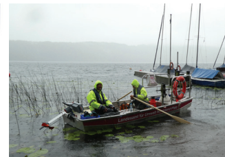
Biologen bei der Gewässerüberwachung