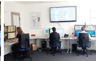
Hydrologische Arbeiten im Hochwasservorhersagedienst