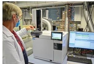
Chemietechniker im Wasserlabor