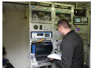
Messtechniker bei der Luftüberwachung ZIMEN