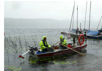
Biologen bei der Gewässerüberwachung