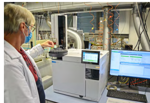
Chemietechniker im Wasserlabor