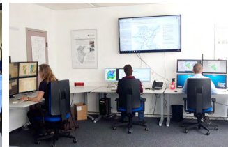
Hydrologische Arbeiten im Hochwasservorhersagedienst