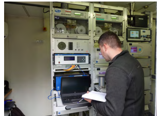
Messtechniker bei der Luftüberwachung ZIMEN