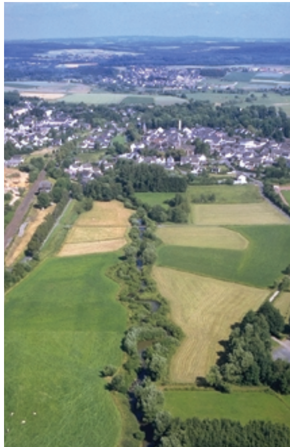
Abb. 3: Der Holzbach im Kreis Neuwied

Das am Holzbach bereits realisierte Entwicklungsziel zeigt einen Zustand, in dem der 5jährige Hochwasserabfluss noch ohne Ausuferung abgeführt werden kann. Die landwirtschaftliche Nutzung in der Aue ist weiterhin möglich. Der geschlängelte Lauf des Holzbaches ermöglicht eine Verbesserung der Sohlenstruktur und eine Erhöhung der Tiefenvarianz. Das Querprofil ist flach mit einer ausgeprägter Vernetzung in den amphibischen Bereich. In dem (relativ schmalen) Gewässerrandstreifen entwickelt sich ein Erlensaum.