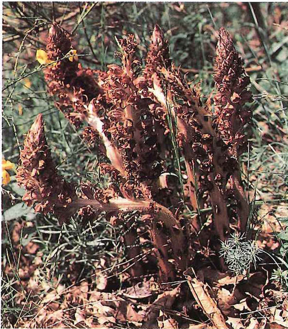
Abb. 3.4/4: Orobanche rapum-genistae - Ginstersommerwurz