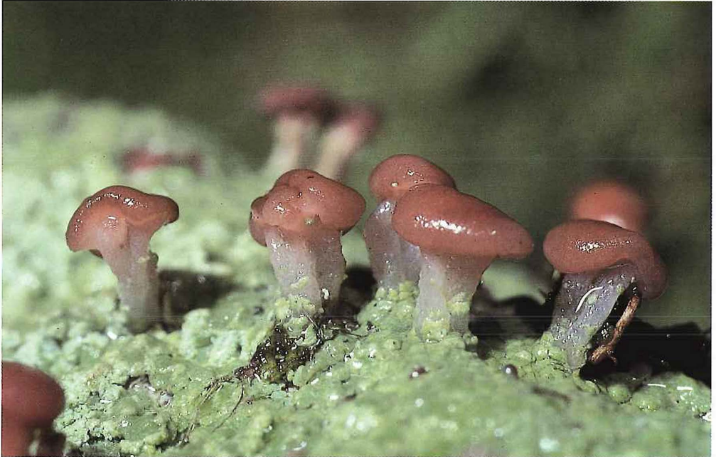
Abb. 3.2/7: Im Gegensatz zu Baeomyces roseus besitzt Baeomyces rufus braune Fruchtkörper und ein mehr grünliches Lager. Sie kommt vor allem an Böschungen und Steinen vor.