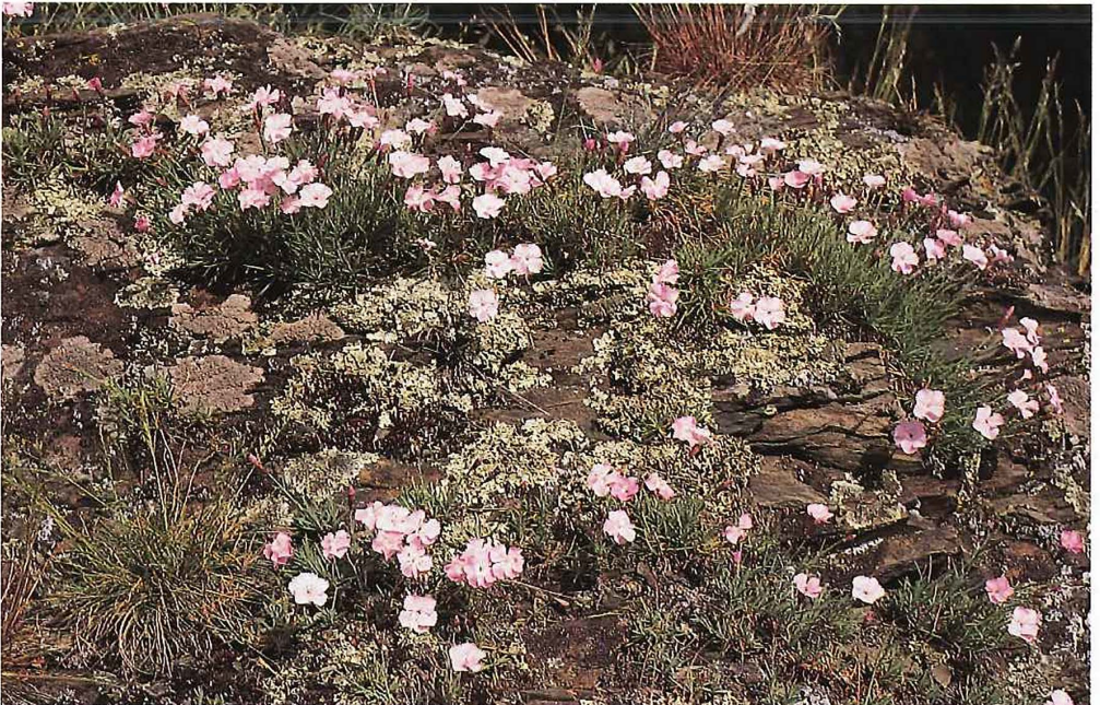
Abb. 3.4/3: Dianthus gratianopolitanus - Pfingst-Nelke