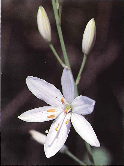
Abb. 3.4/1: Anthericum liliago - Astlose Grasilie