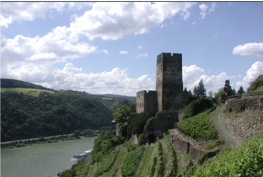
Terrassenweinberge mit Trockenmauern an der Burg Gutenfels