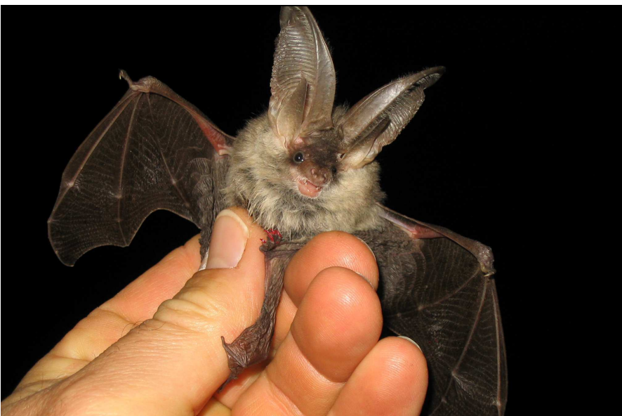
Bechstein-Fledermaus – typischer Wintergast in den Schieferstollen