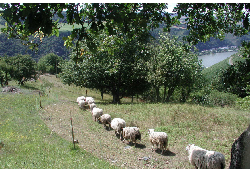
Schaf-/Ziegenbeweidung auf Magerrasen oberhalb Burg Gutenfels