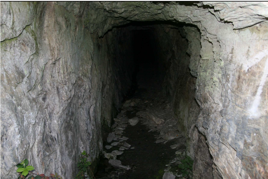
Schieferstollen bei Kaub