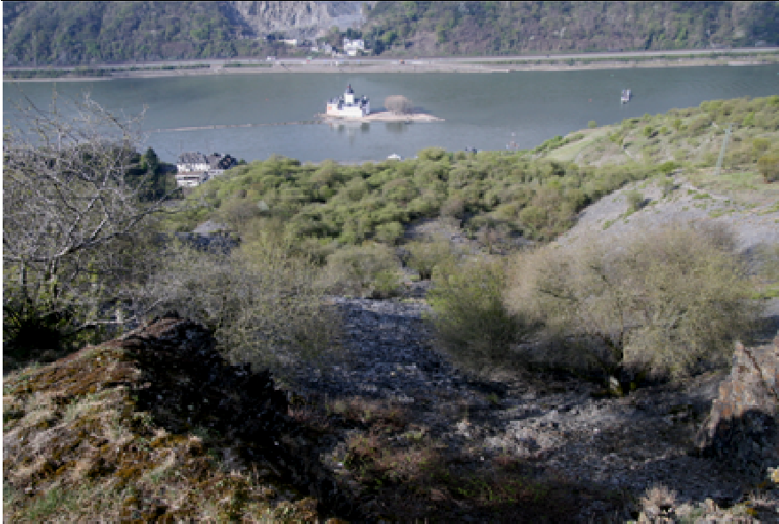
Hang mit Schieferhalden von der Kauber Platte aus