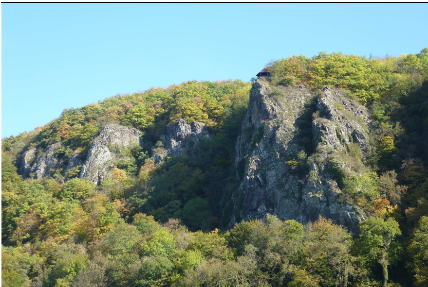
Offene Felshänge und Waldbereiche, Ausschnitt