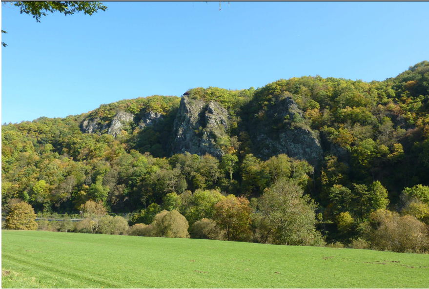
Offene Felshänge und Waldbereiche an der Lahn bei Cramberg