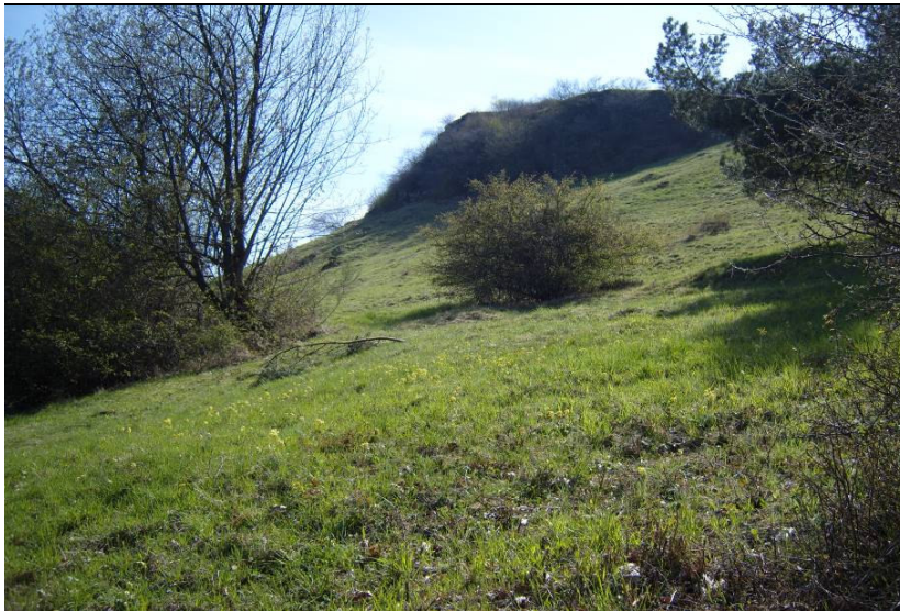
Osthang am Kraterwall NSG Ettringer Bellberg, Frühjahrsaspekt mit Schlüsselblumen