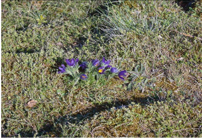
Küchenschelle im NSG Ettringer Bellberg