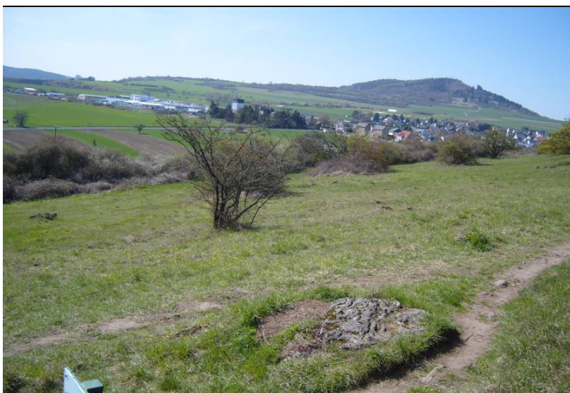
Ausschnitt der Beweidungsfläche nach dem Beweidungsgang