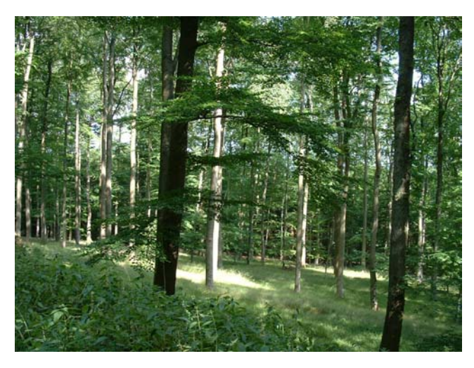
Buchen-Altholz an den Südhängen des Hochbermels