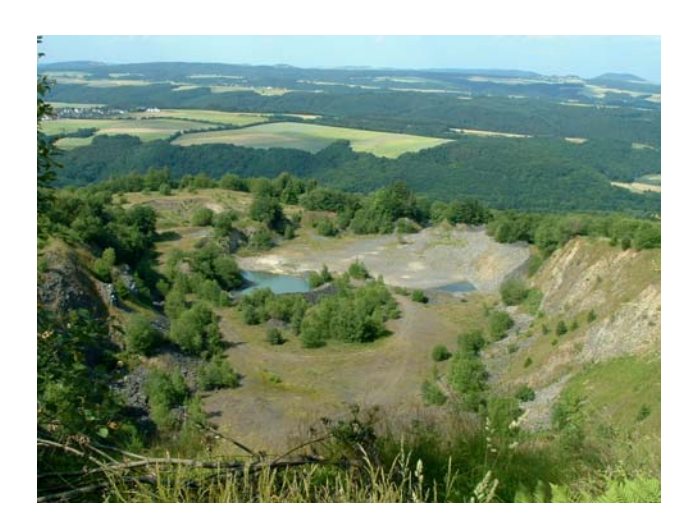
Blick ins Abbaugelände, im Hintergrund die Osteifel

Das im Jahr 2000 ausgewiesene Naturschutzgebiet Hochbermel liegt in der Osteifel im Norden von Rheinland-Pfalz. Es umfaßt mit 64 ha den Hochbermel südöstlich der Ortschaft Bermel und grenzt im Westen direkt an das NSG Kleiner Bermel.