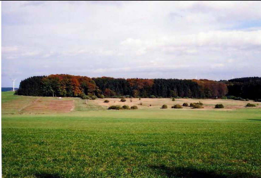
Abb.2 Hier treffen die alte und die neue Welt unmittelbar aufeinander : links eine gut gedüngte, moderne Weidelgras-Monokultur; rechts ein Teil der uralten, mageren Borstgrasrasen; in der Mitte ein zum Schutzgebiet gehörender Wiesenstreifen als Pufferzone, um Stickstoffeintrag aus der Gülle abzapfen. Jegliche Art von Düngung ist Gift für die Arten der Borstgrasrasen.