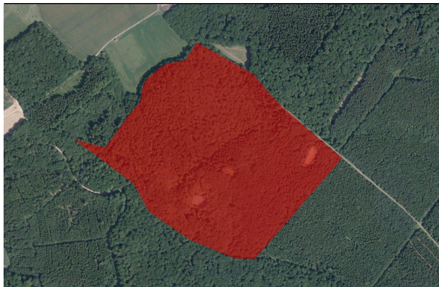
NSG (rot) im Luftbild