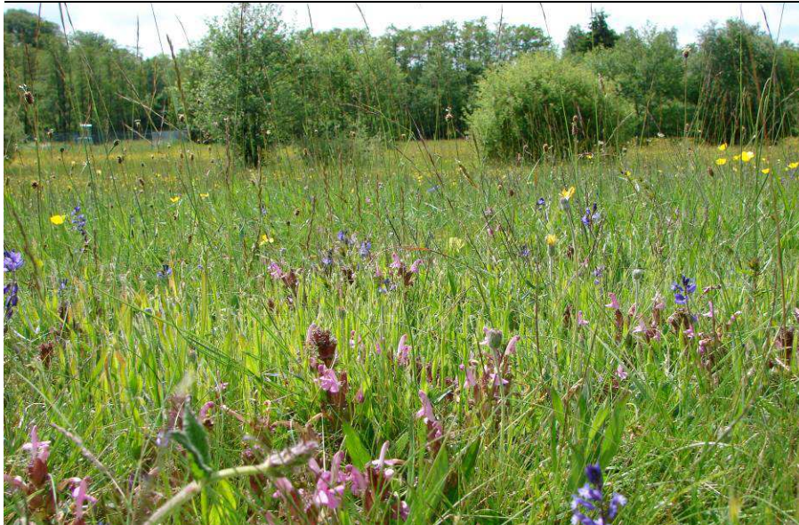
Borstgrasrasenbereich im Grünlandkomplex