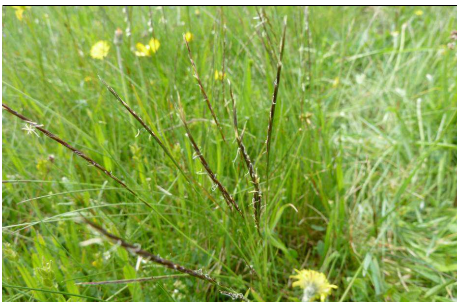
Seltene und besondere Arten im Gebiet:

Das namensgebende Gras der Borstgrasrasen: Borstgras Nardus stricta