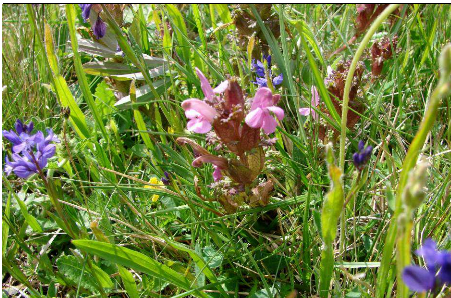
Seltene und besondere Arten im Gebiet:

Das gefährdete Wald-Läusekraut Pedicularis sylvatica ist auf die extensive Nutzung von mageren Feuchtwiesen angewiesen. Bei Intensivierung und bei Brachfallen der Flächen verschwindet es.