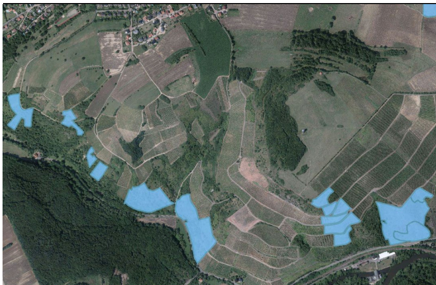
Biotoppflege-Maßnahmenflächen im Gebiet