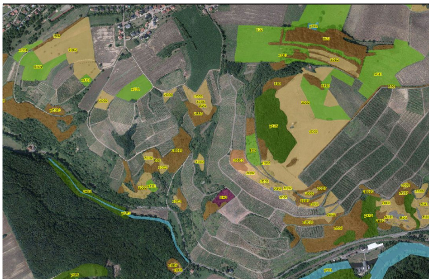
Biotopkartierung im Gebiet