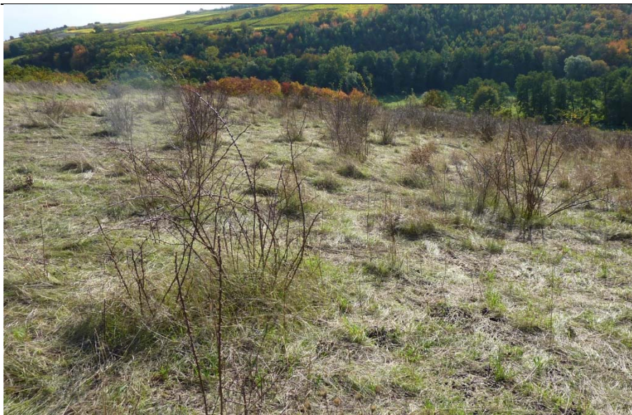
Landespflegeflächen nach der Beweidung