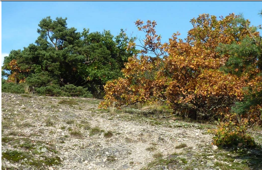
Eichen-Trockenwald auf der Porphyrkuppe des Höllberges