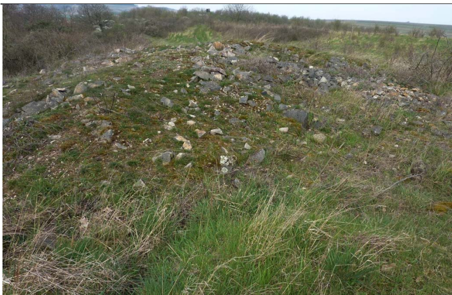
Steinriegel am Haarberg