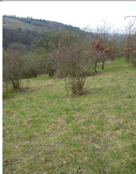
Verbuschte Streuobstwiese vor und nach der Freistellung