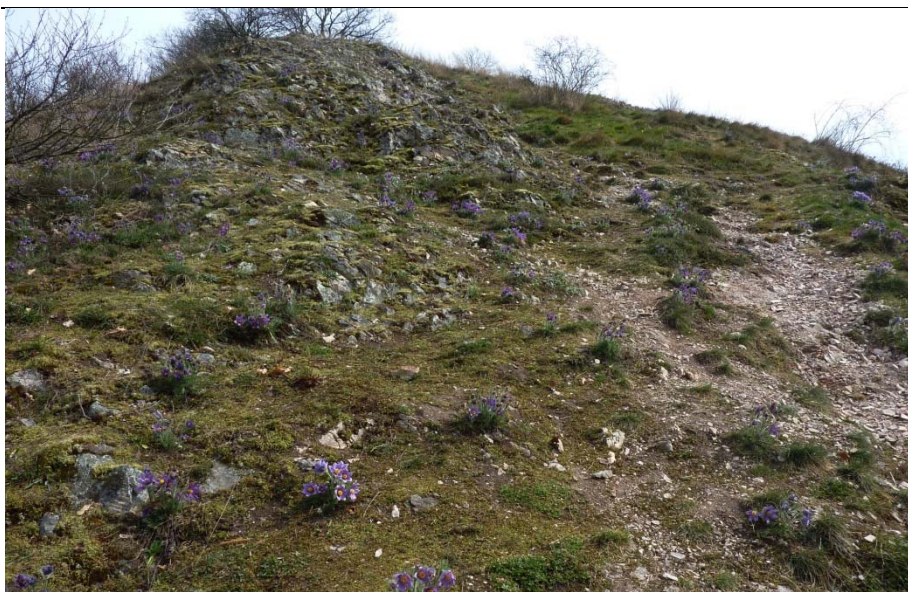
Felstrockenrasen am unteren Höllberg zur Blütezeit der Küchenschellen Ende März