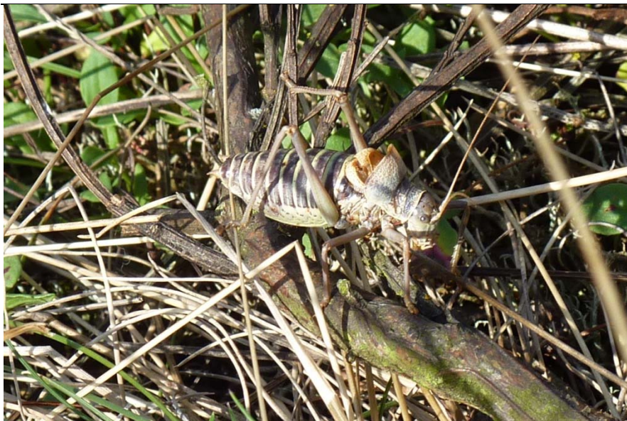
Westliche Steppen- Sattelschrecke ( Ephippiger ephippiger vitium )