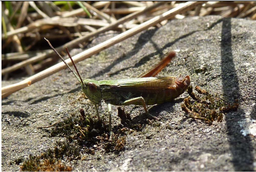
Schwarzfleckiger Grashüpfer ( Stenobothrus nigromaculatus ) mit Blessuren