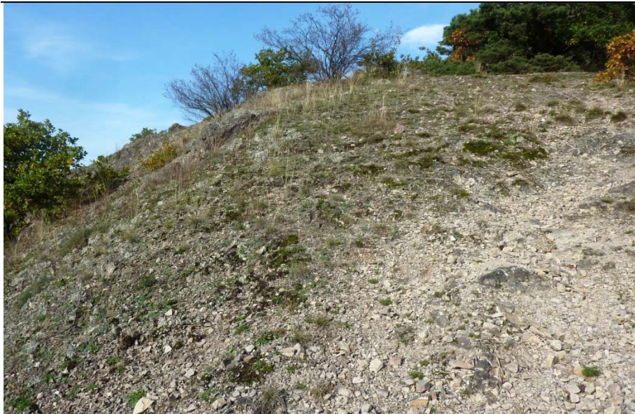
Steiniger Felskopf am Höllberg