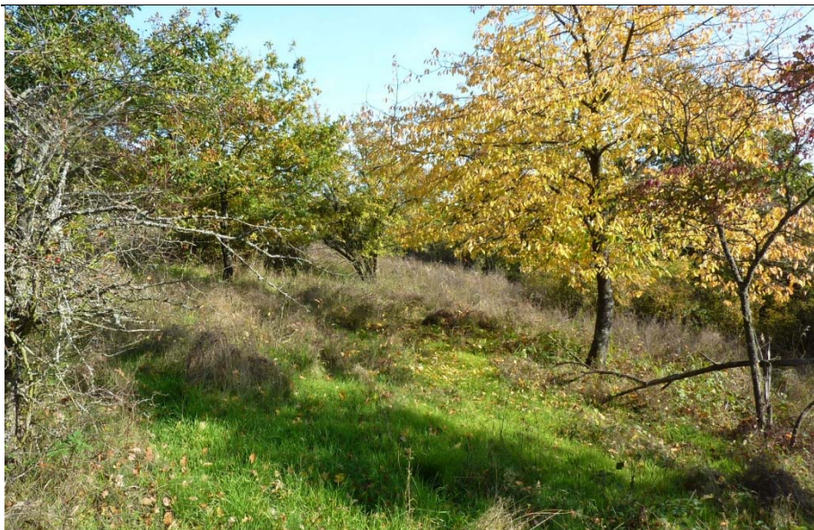
Herbstfärbung der Streuobstwiese am Höllberg