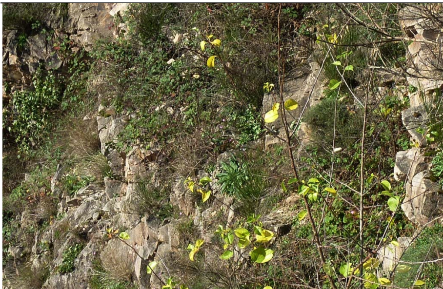
Blick in den alten Steinbruch am Haarberg