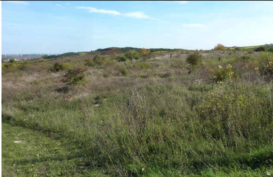
Landespflegeflächen zwischen Haarberg und Dietrichsberg vor der Beweidung