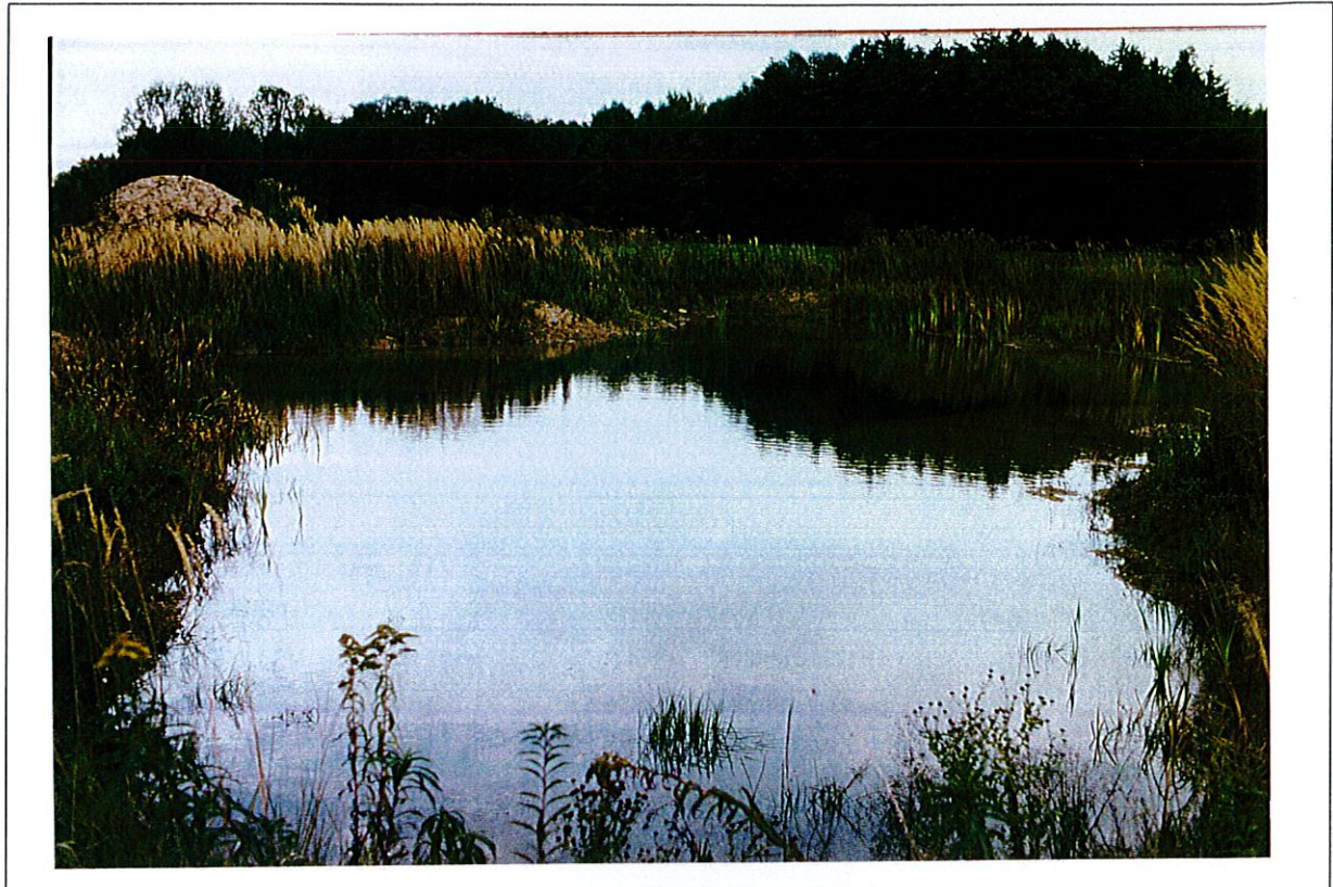
Abbildung 1 Standort 27 a: Tümpel am Panzergraben (SÜW) SE Steinfeld. Westlichster von insgesamt fünf 1996 / 1997 neu angelegten Tümpeln beiderseits des Panzergrabens. Bereits im zweiten Jahr vom Springfrosch als Laichgewässer angenommen.